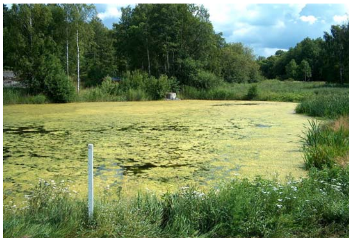
Dammen före installation.