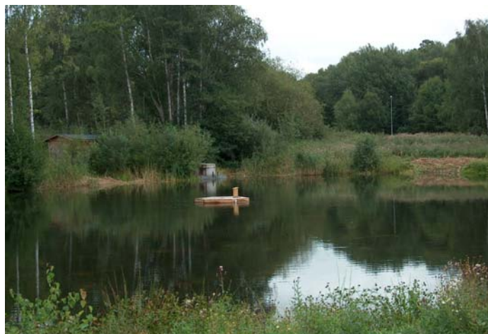
Efter installation av Airturbo.